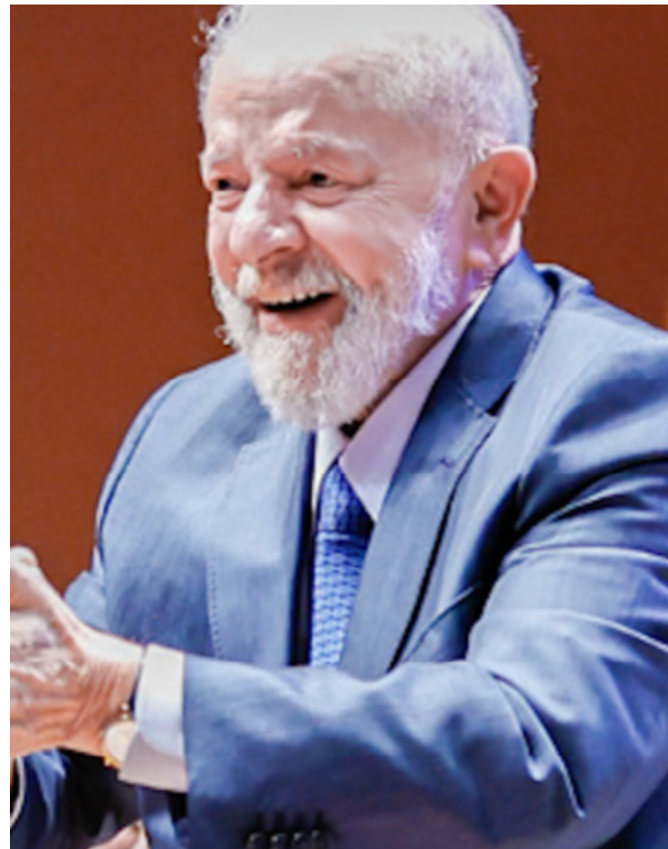
Lula da Silva: ataques à Operação Lava Jato formada pela Justiça brasileira

É importante lembrar que a Operação Lava Jato, que investigou desvios na Petrobras, completou 10 anos agora em março. Ao longo da última década, a operação conseguiu recuperar R$ 2 bilhões para os cofres públicos por meio de acordos de delação premiada e de leniência homologados pelo Supremo Tribunal Federal (STF).