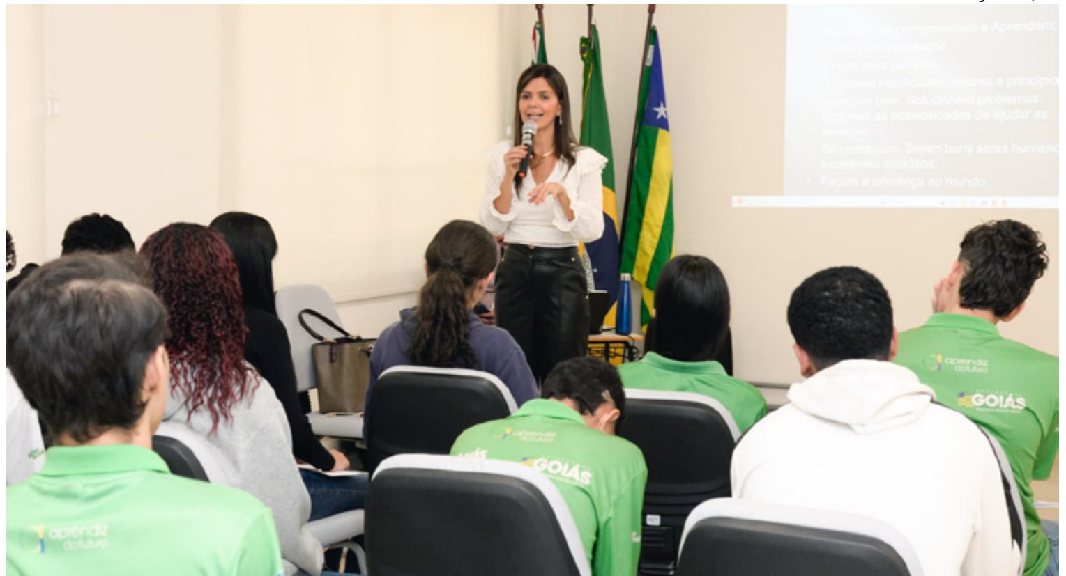
Conteúdo foi ministrado pela gerente de Políticas Públicas para Juventude