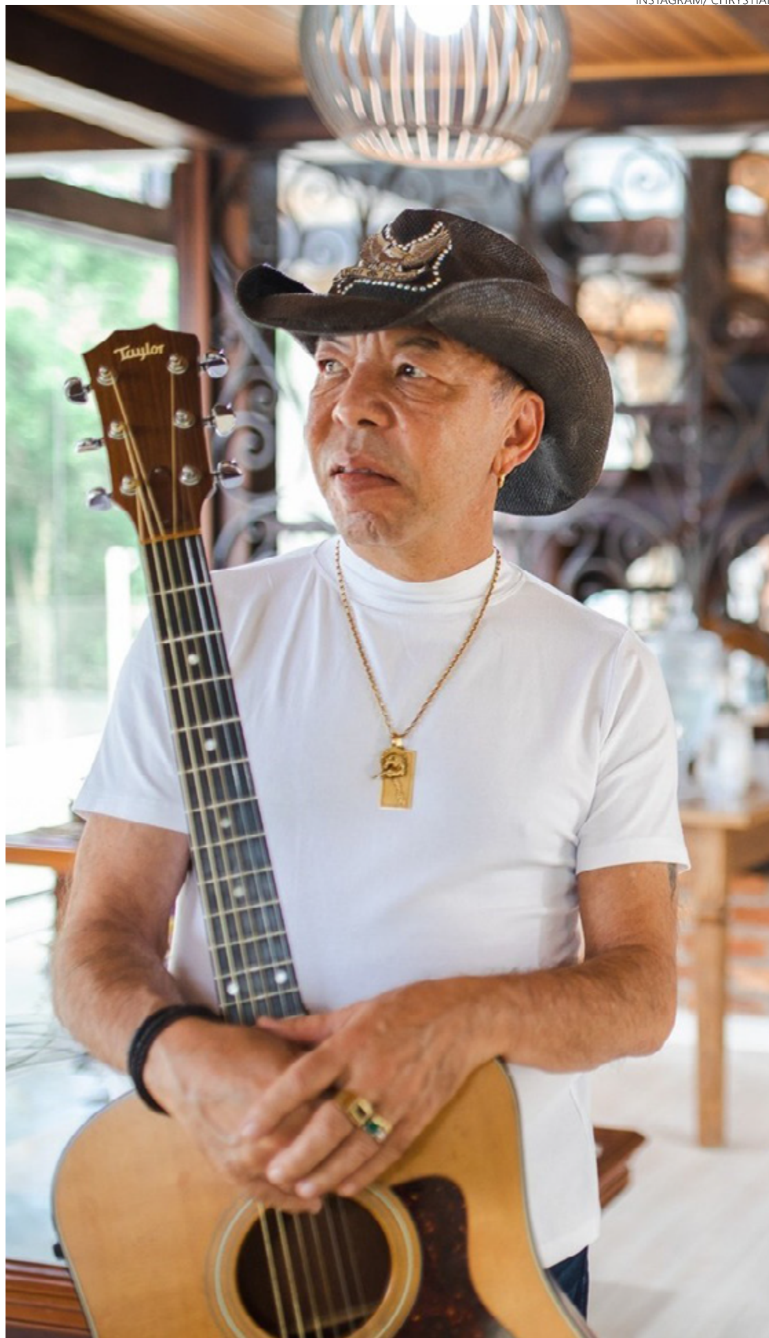
Cantor refinou sertanejo com lirismo, epopeia e flerte com blues, rock e latinidade

dbye”, “Tears” também lembra qualquer balada funk-soul da Motown. Murmura Chrystian na primeira estrofe da canção: “Toda vez que vejo seu rosto/ É somente num retrato na parede/ Ela me leva a todos os lugares/ Que costumávamos ir”.