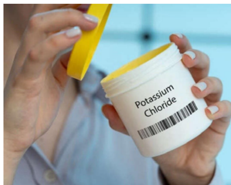
Suplementação de potássio pode ser uma solução eficaz para combater a hipertensão

A suplementação de potássio pode ser uma solução eficaz para combater a hipertensão associada ao consumo excessivo de sal. Promover o uso de sal enriquecido com potássio pode trazer grandes benefícios para a saúde pública, sendo uma intervenção de baixo custo e potencialmente mais fácil de implementar do que a redução drástica do consumo de sal.