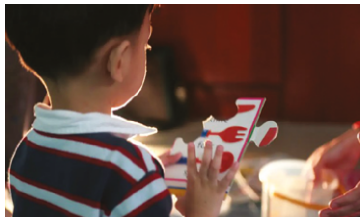
O diagnóstico em crianças é mais perceptível, enquanto, em adultos, fatores podem gerar confusão