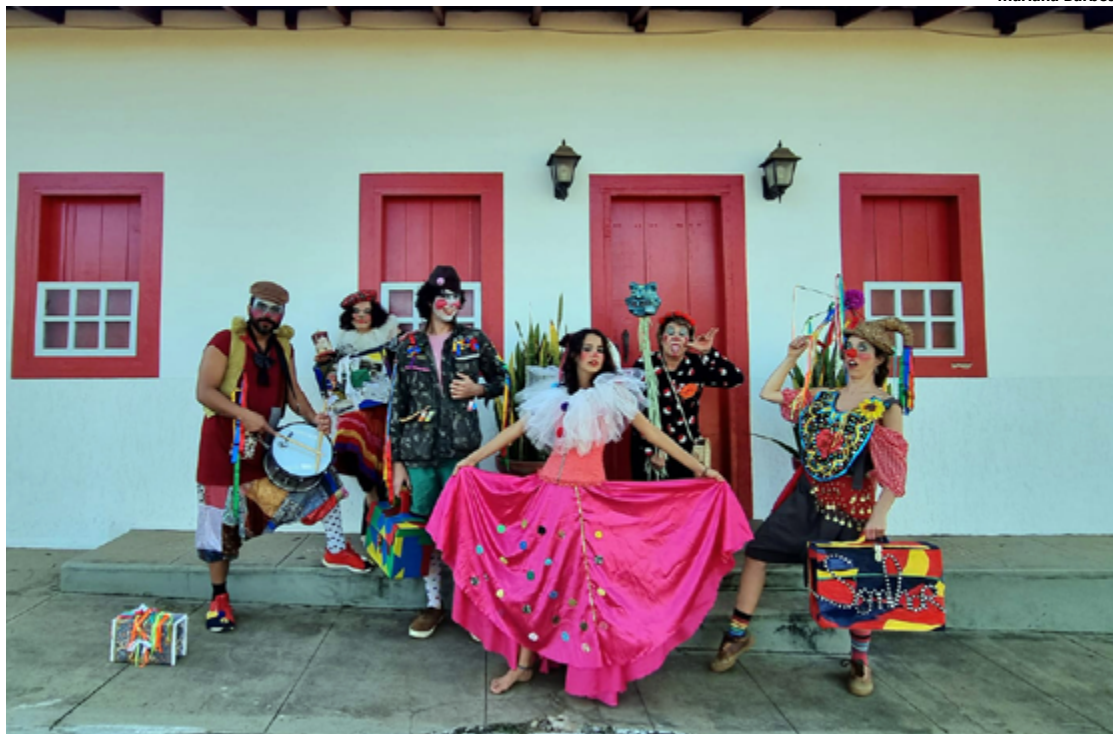
O projeto Olhos D’Água em Cena é uma iniciativa do Núcleo de Arte do Centro-Oeste (Naco), realizada em parceria com a companhia Inventor de Sonhos, com recursos da Lei Paulo Gustavo

Montado na linguagem do teatro de rua, o espetáculo é um desdobramento do ciclo formativo do projeto “Olhos D’Água em Cena”, realizado durante os meses de maio e junho no distrito de Olhos d’Água. Com a facilitação de artistas convidados de Goiás, Distrito Federal e Bahia, foram oferecidas à comunidade oficinas nas áreas de Palhaçaria, Criação e Confeção de Máscaras Cênicas, Montagem de Teatro de Rua, Figurino e Deslocamentos – Convergências e Divergências Migratórias.