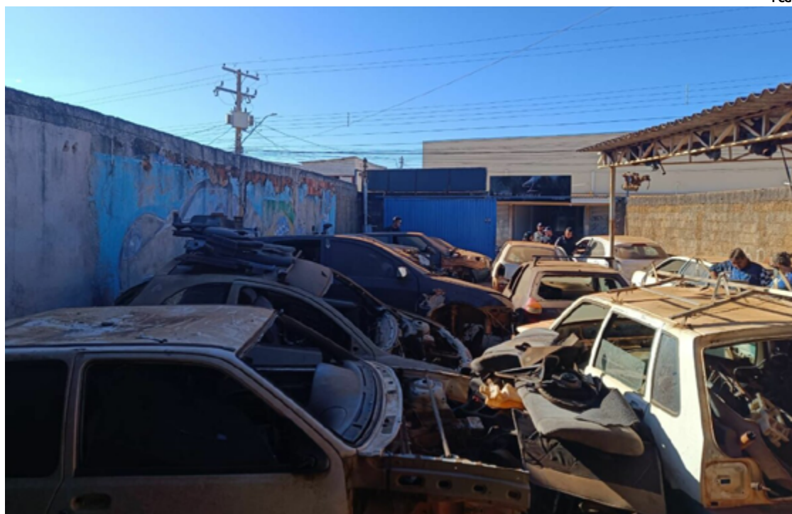
Os agentes realizaram buscas em oficinas e lojas de autopeças, procurando por evidências que confirmassem as suspeitas de adulteração e receptação

A operação é parte de um trabalho para combater crimes que afetam diretamente a segurança e a propriedade dos cidadãos. A investigação é motivada pelo aumento de casos de veículos com sinais identificadores adulterados e pela constatação de que alguns estabelecimentos comerciais