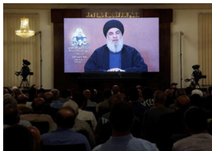
Hezbollah, grupo libanês pró-iraniano, aumenta risco de uma guerra em grande escala no Oriente Médio

A situação na fronteira entre Israel e Líbano está extremamente tensa, com o risco de uma guerra em grande escala mais alto do que nunca. A comunidade internacional, especialmente os Estados Unidos, está tentando mediar a situação para evitar um conflito maior. A retórica do Hezbollah, embora agressiva, pode ser uma estratégia para evitar uma escalada, mas a situação permanece volátil e imprevisível.