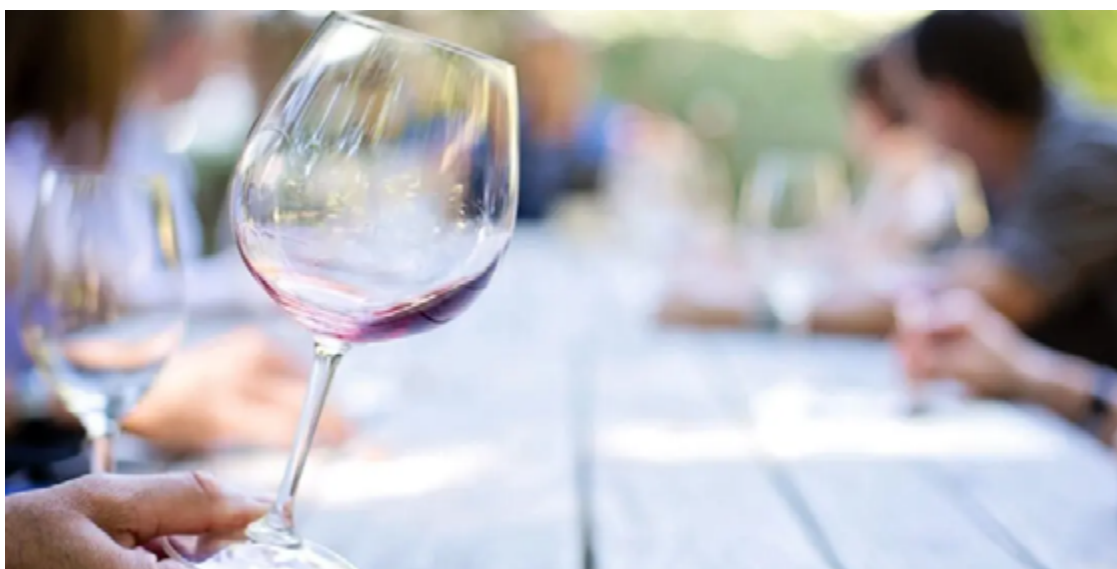
Wine Jazz Piri vai promover durante quatro dias, desta quinta-feira (20/06) até o próximo domingo (23/06), degustações orientadas de vinhos premiados

“O Wine Jazz foi pensado para dar visibilidade à produção regional de vinhos produzidos no cerrado, o mais novo terroir brasileiro, e que recentemente vem