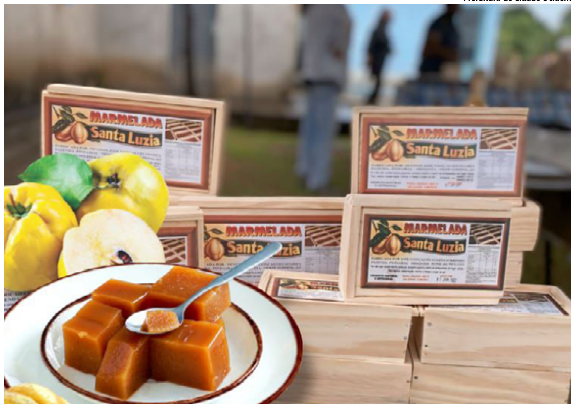
Marmelada é um dos destaques da gastronomia de Cidade Ocidental

“O Mapa do Turismo é um instrumento crucial que reúne